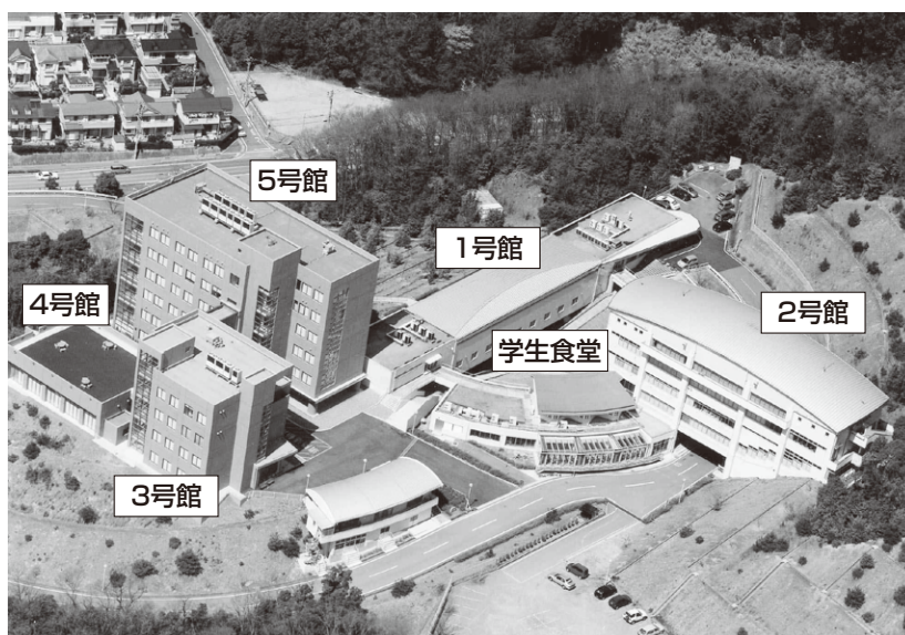
（キャンパス案内図）