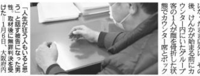
※満席状態だが、関係者以外省略。取材に基づ

「主文、被告人は無罪」。1月17日の大阪地裁の法廷に2度、裁判官の声が響くと、男性は目を閉じて判決理由に聞き入った。 男性が「被告人」になった契機は令和2年2月2日未明の大阪府内のラウンジ店内。出入り口近くから並ぶカウンタ1席、奥のボックス席はほぼ満席だった。判決によると、男性の知人がカラオケ中にカウンタ1席のグループ客とけんかになり、複数人がもみ合いになったまま店外に。その後、けんかが始まる前にカウンタ1席にいたグループ客の1人が顔を骨折した状態でカウンタ1席とボックス席の間に倒れ込んだ。 男性が警察に呼び出されたのは9カ月後。必死に否認したが、起訴された。昨年9月に始まった裁判で検察側は「けんかに近づいた男性の前にはたかると、突然殴られた」という被害証言に加え、被害者が倒れていた場所がともとも男性がいた場所と近かったことを証拠として犯人性を主張。被害者も法廷で強い処罰感情を訴えた。 一方、弁護側は「犯行場所が見える位置にいたグループ客のメンバーや従業員による「男性が殴ったのは見ていない」という証言を重視。「物理的にも犯行は不可能」と主張した。けんかが起きたカウンタ1席の通路は、1人立つと